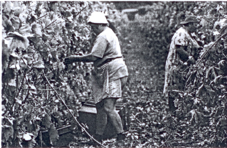
Podaci upisani u registar 2011. vrijedit će i 2021. godine

- Intencija zakona je da se gro poticaja daje prema površini obradivog zemljišta, prema hektaru livada i pašnjaka za stočarstvo, a prema hektaru obradive površine za ostale ratarske proizvodnje, i to 2.250 kuna, dok Europa ima 250 eura. Zato je nama stalo da Hrvatska uđe u EU sa što više obradivog zemljišta upisanog u registar. Silkovito govoreći, ono što poljoprivrednik bude imao upisano 2011., imat će i 2021. godine. Osim ako se ne bude promijenila agrarna po-