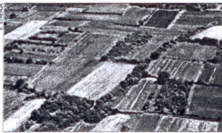
Mnogi poljoprivrednici obrađuju državno zemljište za koje ne mogu ostvariti poticaj jer nemaju papire o zakupu

na na državnom zemljištu koji nisu dani u zakup ni prodani. Vjerujem da će općine to uvažiti kada raspisuju natječaj.