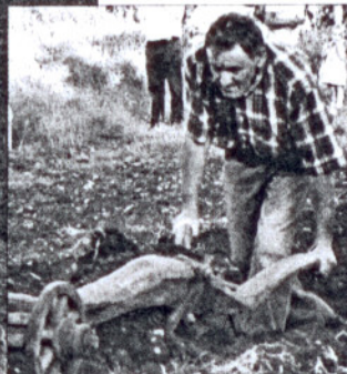
Oranje sa šestogodišnjim plugom