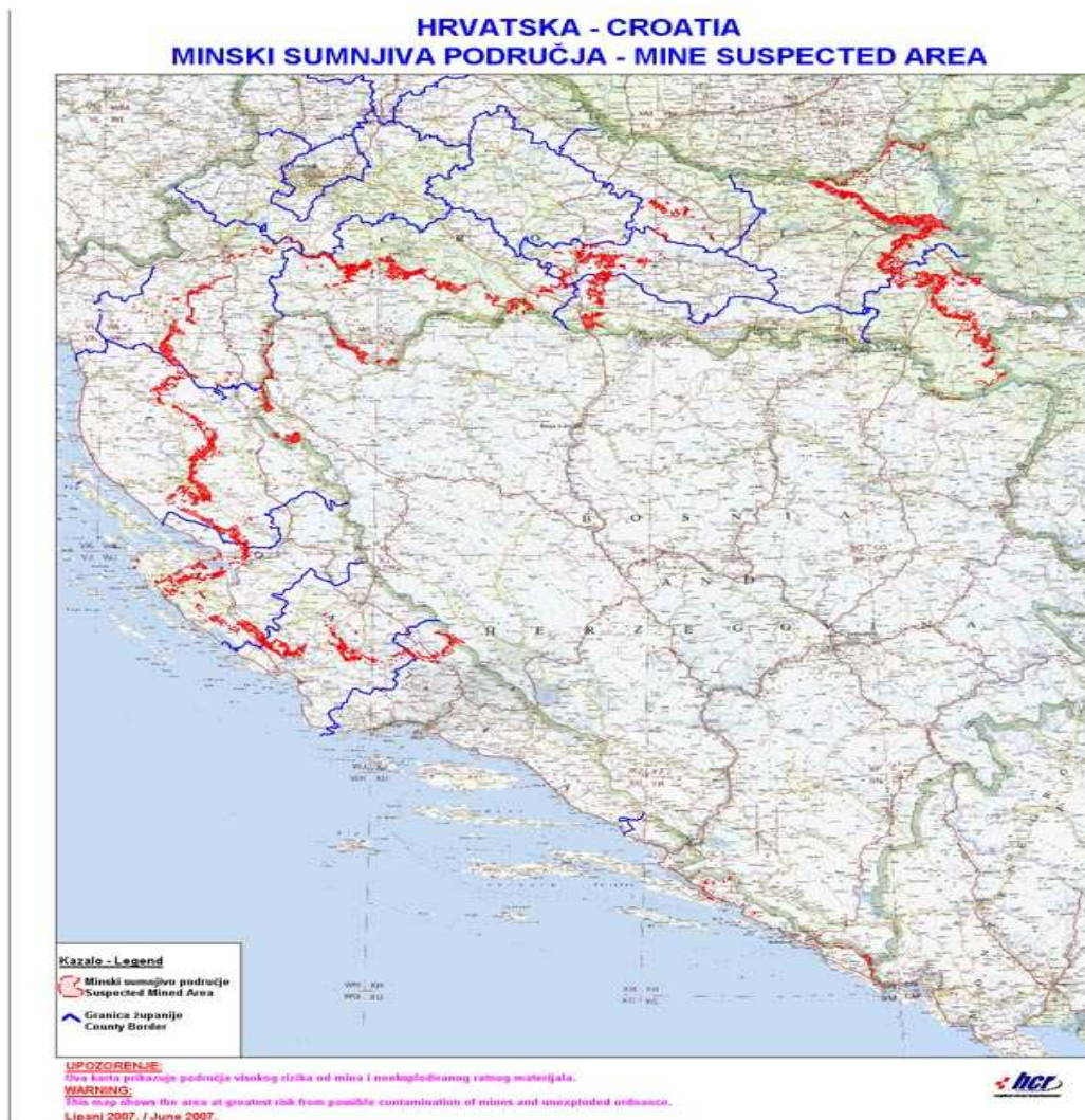
Slika 2: Minski sumnjiva područja u RH